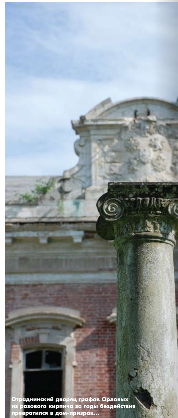
Отрадинский дворец графов Орловых из розового кирпича за годы бездействия превратился в дом-призрак...

Воскресенский р-н: главный дом усадьбы Дубки (дом Машеньки); деревянная Ильинская церковь XVIII в. в усадьбе Петровское;