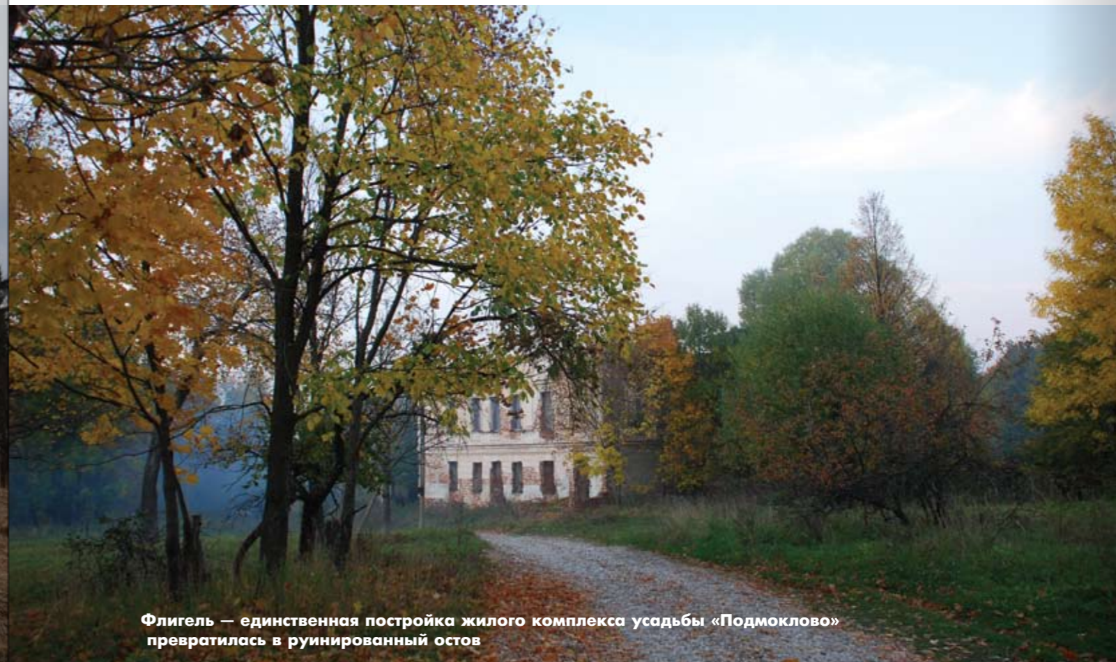
Флигель — единственная постройка жилого комплекса усадьбы «Подмоклово» превратилась в руинированный остов