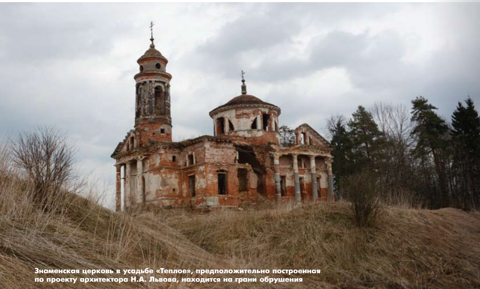
Знаменская церковь в усадьбе «Теплое», предположительно построенная по проекту архитектора Н.А. Львова, находится на грани обрушения